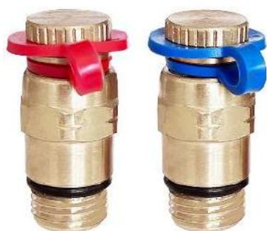
Рис. 2. Комплект ниппелей (пара) G1/4" для ручного балансировочного клапана.